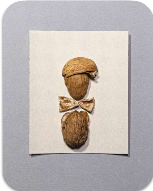
C'est parti !