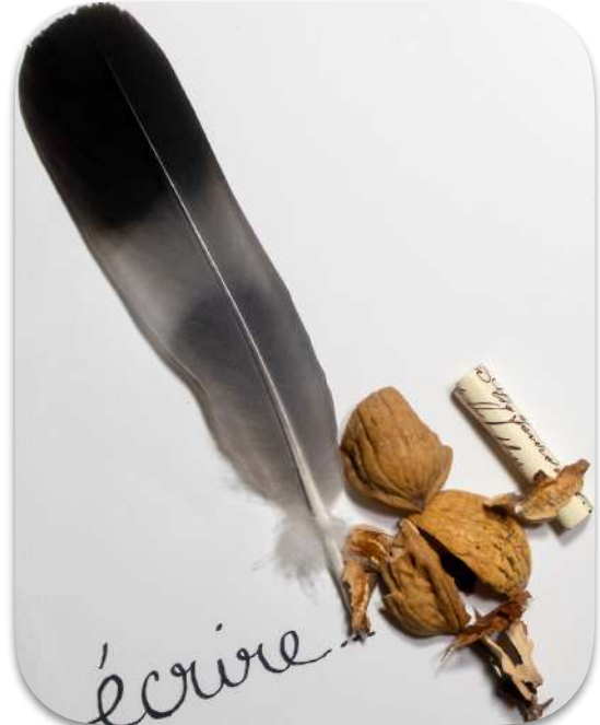
sur la route des mots